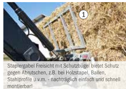
Staplergabel Freisicht mit Schutzbügel bietet Schutz gegen Abrutschen, z.B. bei Holzstapel, Ballen, Stahlprofile u.v.m. - nachträglich einfach und schnell montierbar!