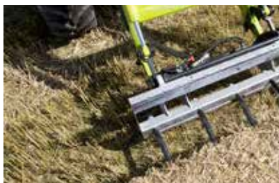
Führungsschiene mit verbauten Rundballenzinken