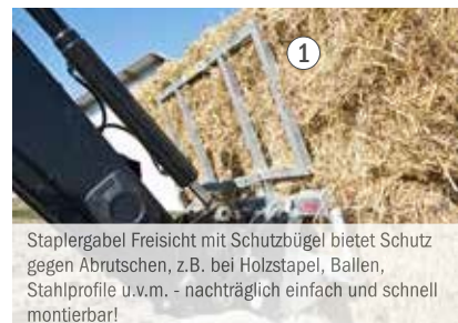
Staplergabel Freisicht mit Schutzbügel bietet Schutz gegen Abrutschen, z.B. bei Holzstapel, Ballen, Stahlprofile u.v.m. - nachträglich einfach und schnell montierbar!