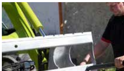
Einfachste Umrüstung bei Verwendung von Rundballenzinken durch vorhandene Konusbuchsen (verschraubbar).