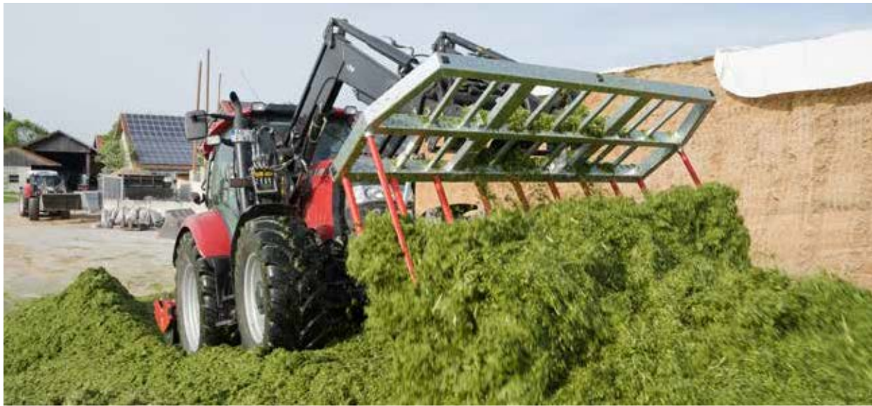
Lieferung inkl. seitlichen Frontladerzinken