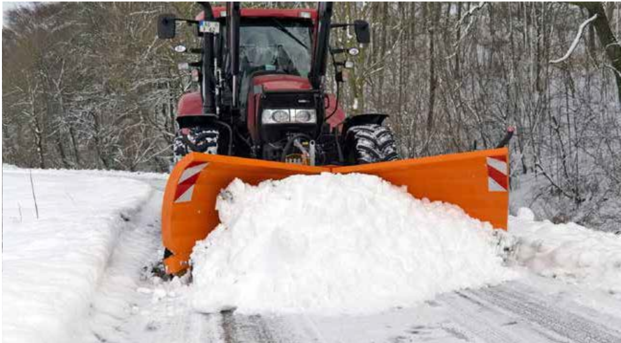
2 hydraulisch schwenkbare Flügel - diese lassen sich separat steuern, sodass individuelle Winkel-, Pflug- oder V-Stellungen gewählt werden können.

Schneeräumen ist ein wichtiger Job für landwirtschaftliche Schlepper während der Wintersaison. Das Fliegl Agro-Center liefert dafür mittlere Schneepflüge in vier Breiten: 2,3 m, 2,7 m, 3,0 m und 3,3 Meter - jeweils mit serienmäßiger Dreipunktaufnahme. Das Schneeschild »Mammut« arbeitet leise, dank seiner extra robusten Polyurethan-Verschleißleiste.