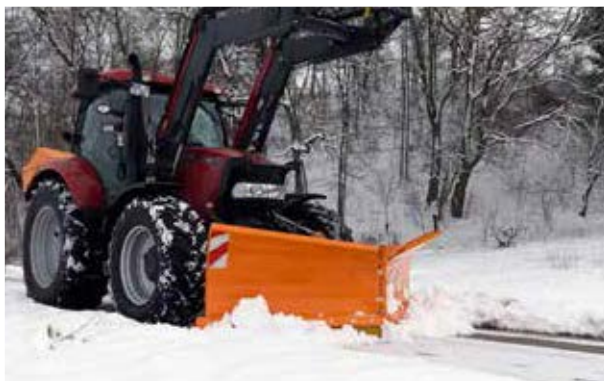
Abb. Verzinkt und zusätzlich Schutzlackiert für besten Rostschutz