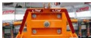
Innovativer Dreipunktbock - gleicht Bodenunebenheiten aus