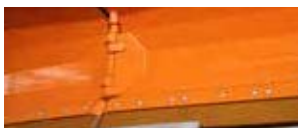
Enorm robuste Verschleißleiste aus Polyurethan (200 x 40 mm)