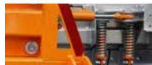
Überlastsicherung durch Federklappen gewährleisten beschädigungsfreies Fahren