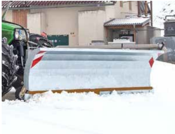
»Mammut Mono« verzinkt, Schildhöhe: ca. 955 mm

Schneeräumen ist ein wichtiger Job für landwirtschaftliche Schlepper während der Wintersaison. Das Fliegl Agro-Center liefert dafür mittlere Schneepflüge in zwei Breiten: 2,7 Meter und 3,0 Meter jeweils mit serienmäßiger Dreipunktaufnahme. Das Schneeschild »Mammut Mono« arbeitet leise, dank seiner extra robusten Polyurethan-Verschleißleiste.