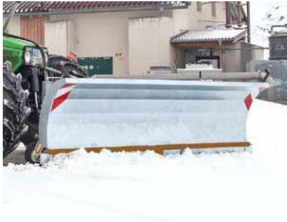
»Mammut Mono« verzinkt, Schildhöhe: ca. 955 mm

Schneerräumen ist ein wichtiger Job für landwirtschaftliche Schlepper während der Wintersaison. Das Fliegl Agro-Center liefert dafür mittlere Schneepflüge in zwei Breiten: 2,7 Meter und 3,0 Meter jeweils mit serienmäßiger Dreipunktaufnahme. Das Schneeschild »Mammut Mono« arbeitet leise, dank seiner extra robusten Polyurethan-Verschleißleiste.