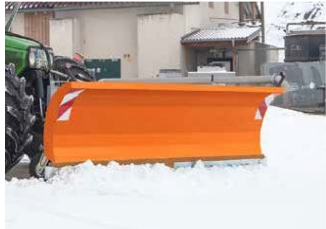
»Mammut Mono« verzinkt und schutzlackiert