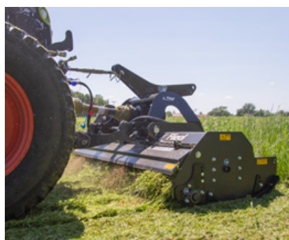
Abb.: verstellbarer Auswurfklappe