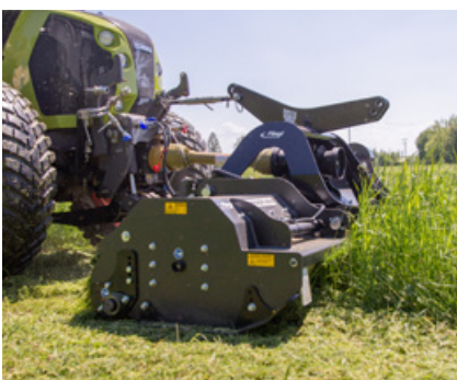
Abb.: bestes Mulchergebnis