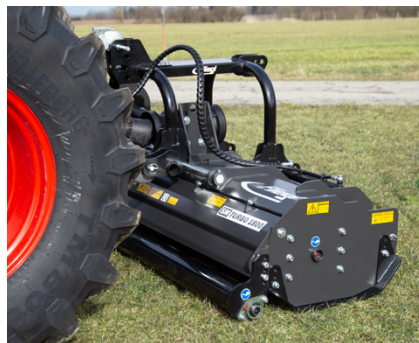
Abb.: verstellbare Auswurfklappe