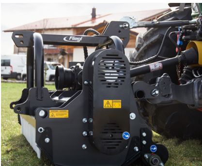
Abb.: kompakte Bauform