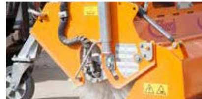
Stufenlose Kehrbesenverstellung durch Stützspindel