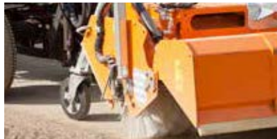
Serienmäßig mit Freikehrmodus: Kehren mit geöffneter Schmutzsammelwanne