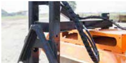
Abb. Kat. Kommunal: Universeller und höhenverstellbarer Aufnahmebock für Kat. Kommunal, Kat. 0 und Kat. I