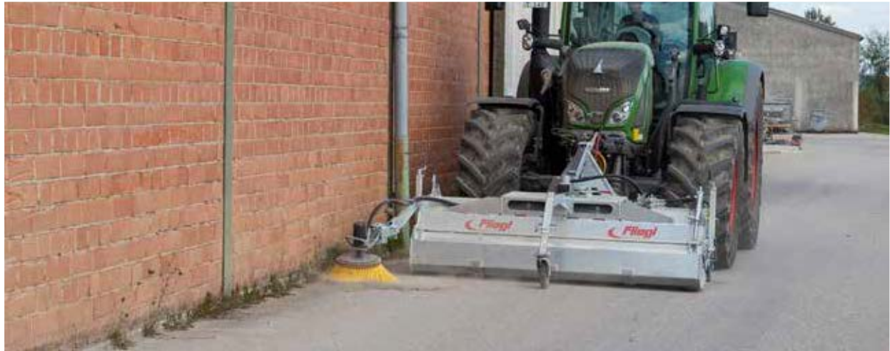
KEH Typ 500 mit Dreipunktaufnahme, hydraulische Schmutzsammelwanne, Seitenbesen und Frontstützrad

Unser Allrounder in robuster und kompakter Bauweise ist für das Reinigen am Hof, Stall und bei stark verschmutzten Straßen Ihr perfekter Helfer!