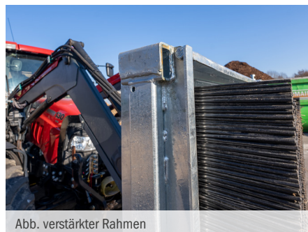
Abb. verstärkter Rahmen