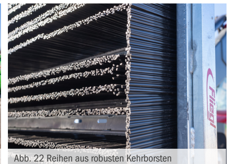
Abb. 22 Reihen aus robusten Kehrborsten