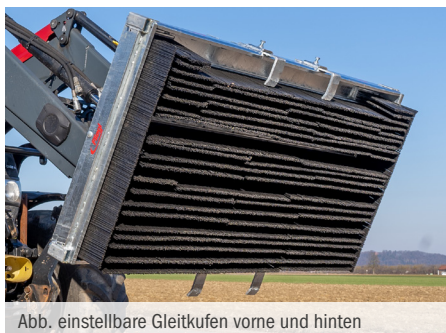
Abb. einstellbare Gleitkufen vorne und hinten