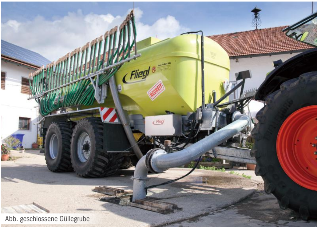
Abb. geschlossene Güllegrube

Technische Voraussetzung für den Betrieb des Elefant sind drei doppelwirkende Hydraulikanschlüsse. Ein vierter Anschluss steuert einen optionalen hydraulischen Ausschub, mit dem der Turbosaugarm fünf Meter Tiefe erreicht. Produktinfos zu Fliegls Turbobefüllern finden Sie im Katalog auf Seite 524.