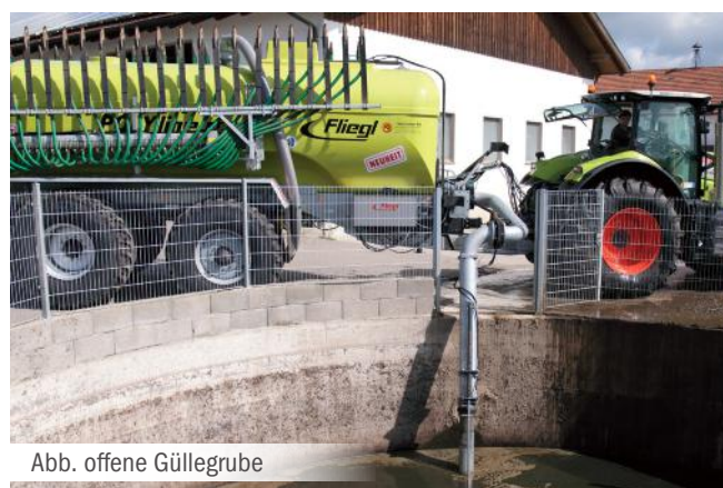
Abb. offene Güllegrube