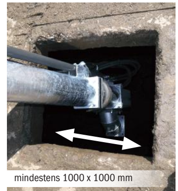
mindestens 1000 x 1000 mm