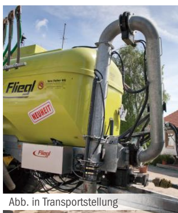
Abb. in Transportstellung