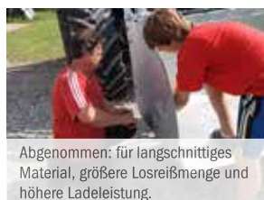
Abgenommen: für längsschnittiges Material, größere Losreifmenge und höhere Ladeleistung.