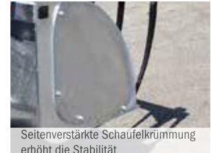
Seitenverstärkte Schaufelkrümmung erhöht die Stabilität