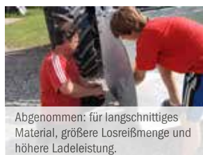
Abgenommen: für längsschnittiges Material, größere Losreifmenge und höhere Ladeleistung.