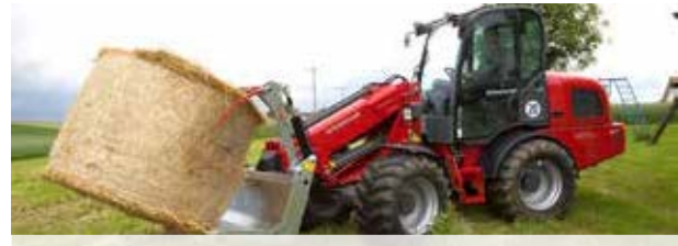
Auch für Hof-, Rad- und Teleskoplader geeignet