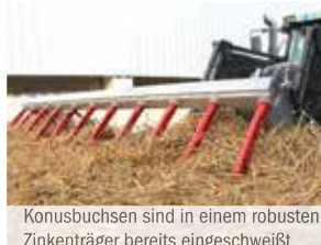
Konusbuchsen sind in einem robusten Zinkenträger bereits eingeschweißt