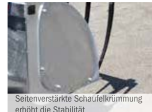
Seitenverstärkte Schaufelkrümmung erhöht die Stabilität