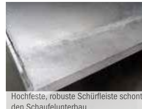
Hochfeste, robuste Schürfleiste schont den Schaufelunterbau