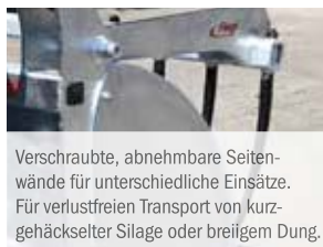
Verschraubte, abnehmbare Seitenwände für unterschiedliche Einsätze. Für verlustfreien Transport von kurzgehäckselter Silage oder breiigem Dung.