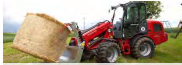
Auch für Hof-, Rad- und Teleskoplader geeignet