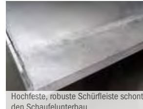
Hochfeste, robuste Schürfleiste schont den Schaufelunterbau