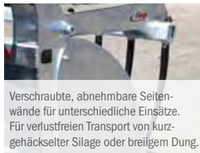
Verschraubte, abnehmbare Seitenwände für unterschiedliche Einsätze. Für verlustfreien Transport von kurzgehäckselter Silage oder breiigem Dung.