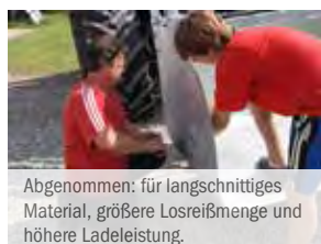
Abgenommen: für längsschnittiges Material, größere Losreifmenge und höhere Ladeleistung.