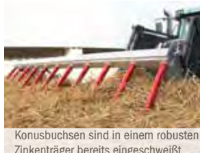
Konusbuchsen sind in einem robusten Zinkenträger bereits eingeschweißt