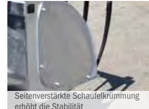
Seitenverstärkte Schaufelkrümmung erhöht die Stabilität