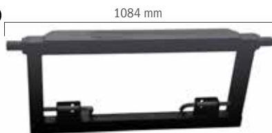
Dreipunktadapter roh - ohne Aufnahme