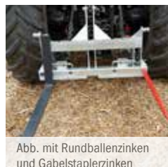
Abb. mit Rundballenzinken und Gabelstaplerzinken