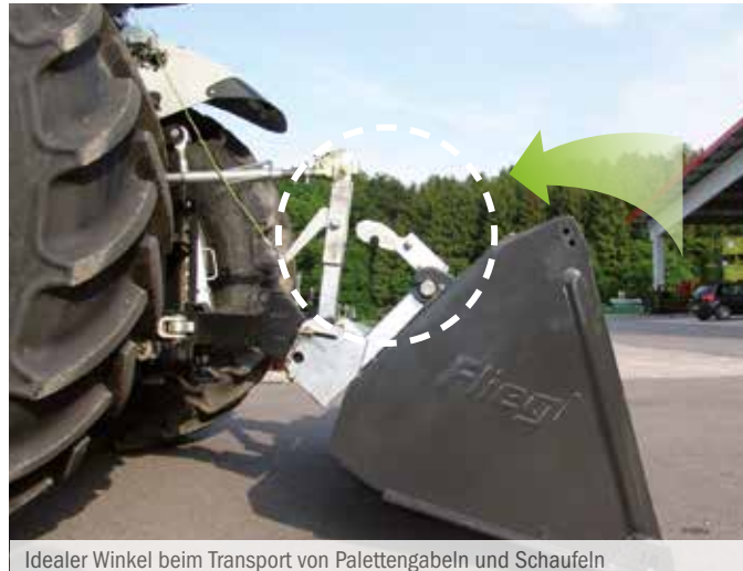
Idealer Winkel beim Transport von Palettengabeln und Schaufeln