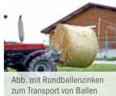
Abb. mit Rundballenzinken zum Transport von Ballen