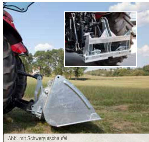
Abb. mit Schwergutschaufel