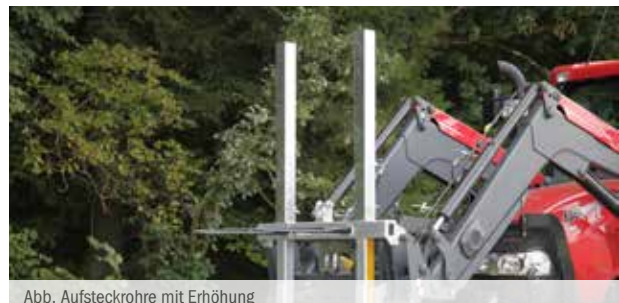
Abb. Aufsteckrohre mit Erhöhung