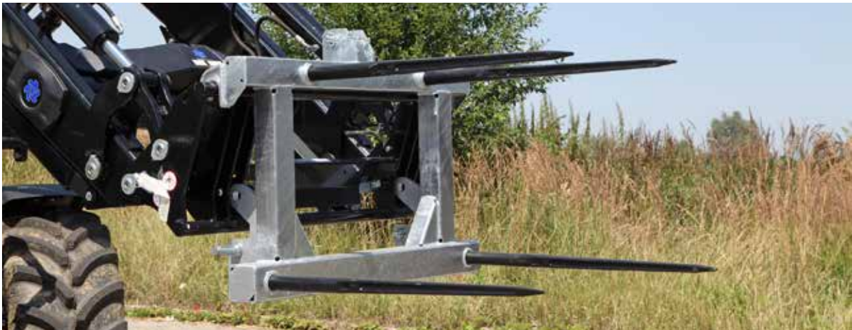
Abb. Ohne Erhöhung mit 4 Rundballenzinken (2 Zinken - Aufpreis)