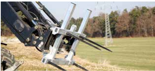
Abb. Mit 4 Rundballenzinken inkl. Erhöhung (2 Zinken - Aufpreis)