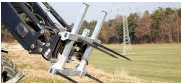
Abb. Mit 4 Rundballenzinken inkl. Erhöhung (2 Zinken - Aufpreis)