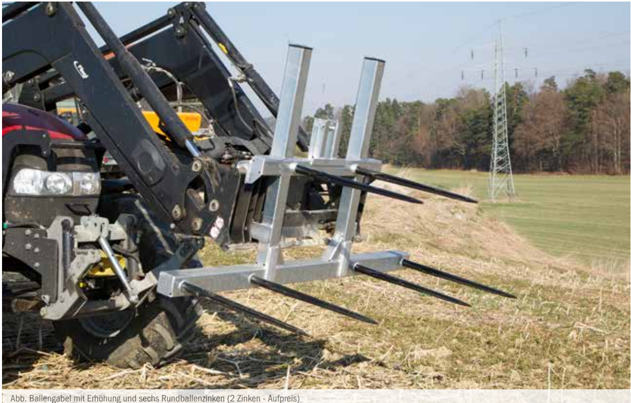
Abb. Ballengabel mit Erhöhung und sechs Rundballenzinken (2 Zinken - Aufpreis)