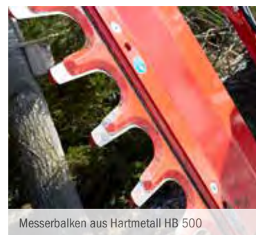
Messerbalken aus Hartmetall HB 500