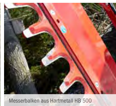
Messerbalken aus Hartmetall HB 500