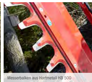
Messerbalken aus Hartmetall HB 500