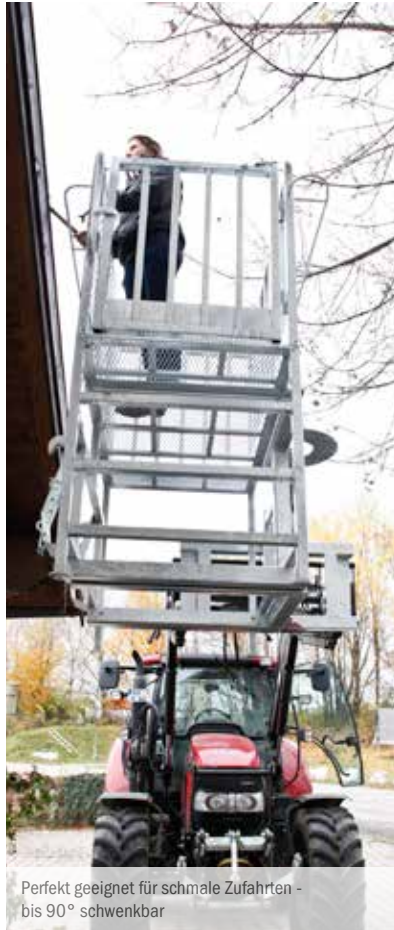
Perfekt geeignet für schmale Zufahrten - bis 90° schwenkbar

Mehr Flexibilität, mehr Einsatzmöglichkeiten, kein Blockieren von Straßen oder Wegen: Die Arbeitsbühne mit Schwenkfunktion für einen platzsparenden Arbeitsablauf eignet sich insbesondere für den Kommunalbereich.