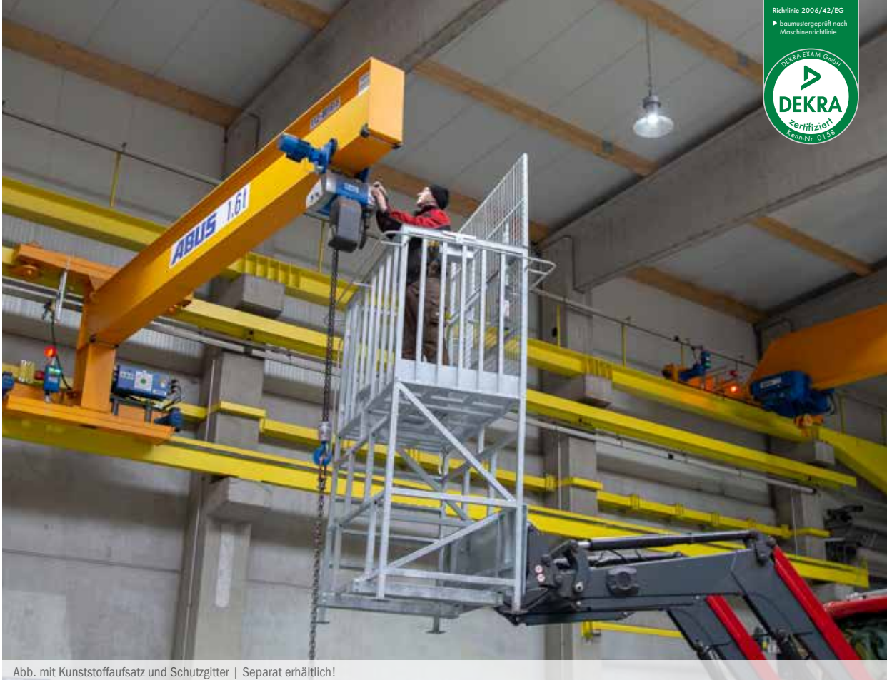
Abb. mit Kunststoffaufsatz und Schutzgitter | Separat erhältlich!

Der Profi im Arbeitsbühnen-Sortiment bietet eine Erhöhung von 1,40 Meter – für sicheres und bequemes Arbeiten an besonders hoch gelegenen Stellen